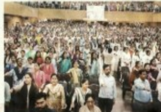
MAKING RIGHT CHOICE: (From top) Students of St Joseph College, Study Hall and City Montessori School took out a march and pledged to make people aware about their voting rights

Both, students and teachers appealed to the public by distributing pamphlets to pedestrians, shopkeepers and vendors. Meanwhile, around 1,000 members of City Montessori School gathered in the Ganga Nagar campus and took a pledge to make the general public aware of their voting rights and improve the voting percentage of the city as compared to previous years. Also, teachers and staff members had sent a special voting appeal message