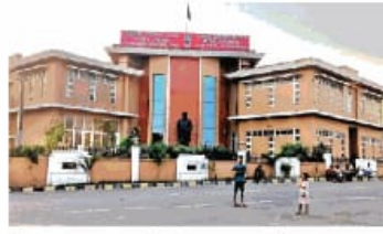
केंद्र सरकार द्वारा लाला टोला में बनवाया गया लोकनायक जयप्रकाश नारायण राष्ट्रीय स्मारक

पहले बिहार के गांवों के विद्यार्थियों को हाईस्कूल पास करने के बाद इंटरमीडिएट करने के लिए उग्र के क्षेत्र में आना पड़ता था, लेकिन अब जहाँ भी इंटर कालेज खुल गए हैं। आरा से कर्नाटकबिटी के लिए गंगा में महुली घाट पर एक पीपल पुल बना है। दोनों तरफ के गांव के लोगों के लिए एक मुख्य सड़क है, जिस पर बलिया, छपरा या पटना जाने के लिए बस और जीप आदि चलती हैं।