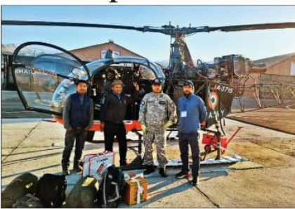
Polling officials arrive in Ladakh on Friday ahead of fifth phase of polls

The poll panel has maintained that poll data can't be manipulated, which for a long time has been strongly supported. "There is no scope in the system to manipulate voter turnout data. In the past too final polling data has changed from the figures published on the day of polling as the numbers are updated," former Election Commissioner Ashok Lavasa said.