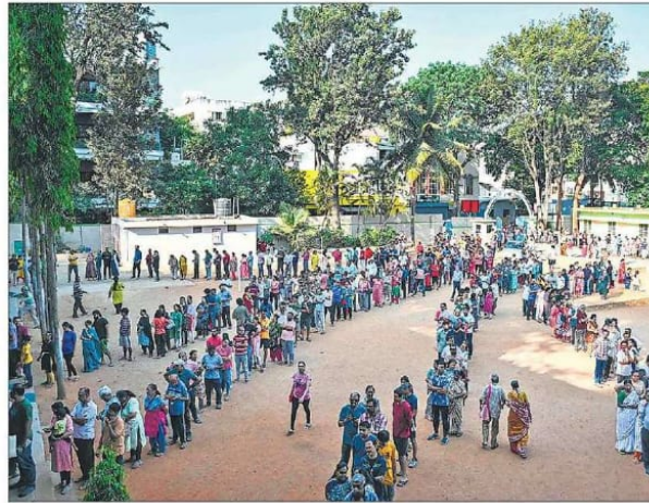
ADR's plea pointed out that the final voting figures showed an increase of 6% from the tentative voting percentage released soon after the conclusion of polling.

In the hearing, which resumed at 6pm (after judges returned from a farewell function of retiring judge Justice AS Bopanna), the court asked EC, "On what basis do you disclose the tentative voting percentage. Is it based