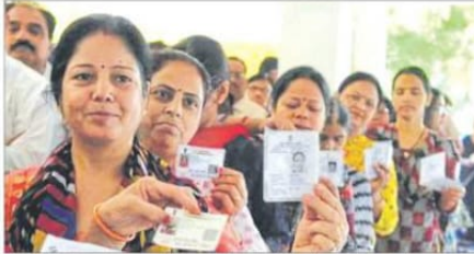
The increasing voter turnout among women in Lucknow signifies a positive shift towards gender parity in electoral participation.